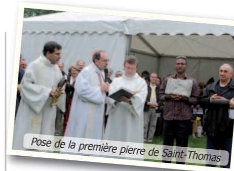
Pose de la première pierre de Saint-Thomas