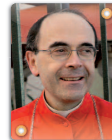
Cardinal Philippe Barbarin Archevêque de Lyon