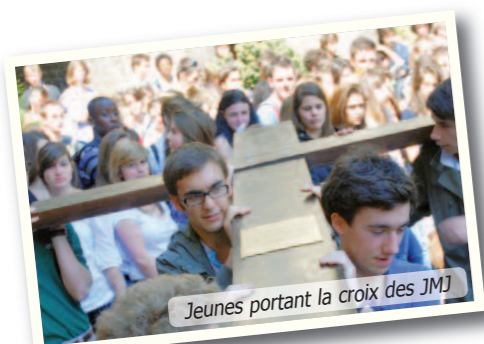
Jeunes portant la croix des JMJ

Mon objectif était d'accompagner au mieux ces jeunes dans ce moment important de leur vie où des vocations s'éveillent. Nous poursuivons dans cet élan avec notamment la messe de retour des JMJ le 16 octobre à Saint-Bonaventure. Pour ma part, j'ai maintenant la grande joie de faire partie de l'équipe des pères du séminaire Saint-Irénée. "