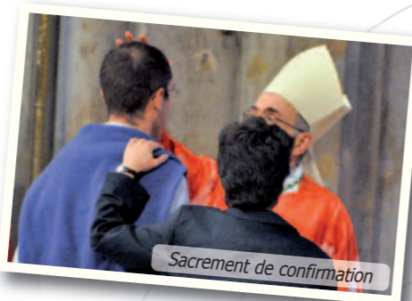
Sacrement de confirmation