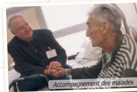
Accompagnement des malades

" La mission d'aumônier d'hôpital est de répondre aux besoins spirituels au sens large des patients, de leurs proches et des soignants. Nous sommes vraiment dans la dimension du lien à la vie, lien qui a pu être rompu du fait de l'hospitalisation.