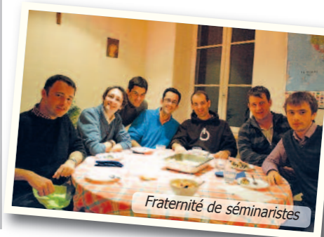
Fraternité de séminaristes

www.enviedebenevolat.fr tél. : 04 78 814 815