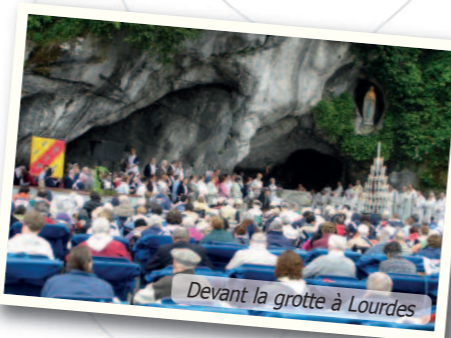
Devant la grotte à Lourdes

Pour tout renseignement : tél. : 04 78 81 48 20 pelerinages@lyon.catholique.fr