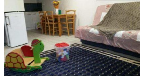
Un appartement a été gracieusement mis à disposition par une famille valnégrienne pour héberger un couple et son bébé

Article tiré du journal - Le Progrès, édition du samedi 10 Mars 2018