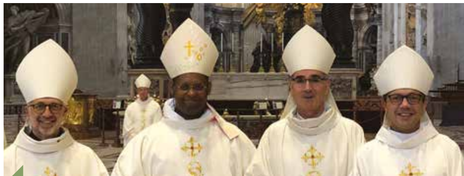
Ici réunis en marge du synode à Rome, les quatre évêques français.