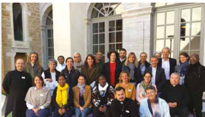
Nouveaux prêtres et diacres, nouveaux laïcs en mission ecclésiale, réunis à la maison Saint-Irénée, ont pu visiter les archives diocésaines et la chancellerie.