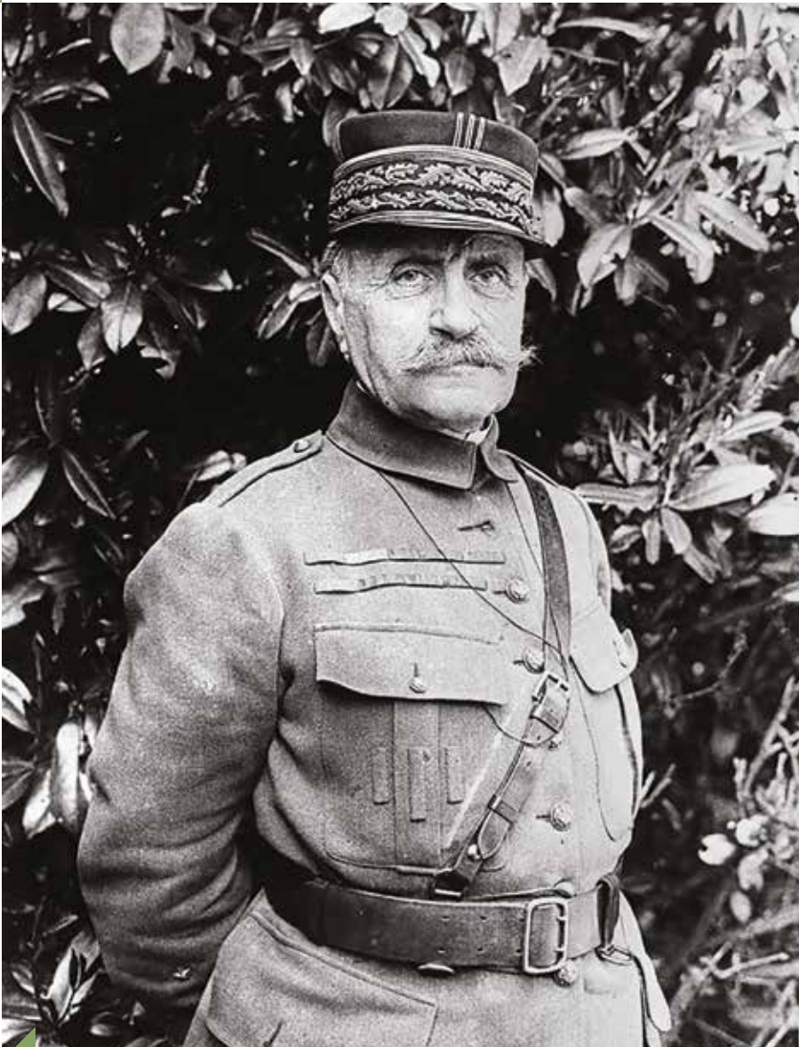
« Le Maréchal Foch leur répondit que signer maintenant épargnerait 60 000 vies humaines ! »