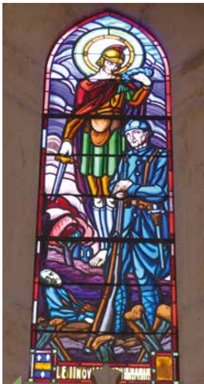
Un vitrail de l'église de Chasselay, en mémoire des poilus morts au combat lors de la guerre de 14-18.

11 novembre prochain, à 8h30. À 15 heures, un temps de recueillement est prévu avec la communauté musulmane au cimetière de la Mulatière, puis à 19h à la cathédrale, les vêpres seront célébrées, et un hommage rendu aux séminaristes et prêtres du diocèse, morts pendant la guerre. Cette journée de commémoration s'achèvera par une bénédiction du monument aux morts. À noter que la Conférence des évêques de France invite toutes les communautés à faire sonner les cloches de leurs églises à 11h.