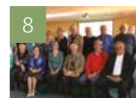
8 VIE DU DIOCÈSE Comptables et trésoriers paroissiaux : les serviteurs discrets !