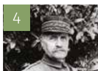
4 LA PAROLE DU CARDINAL 11 Novembre 2018