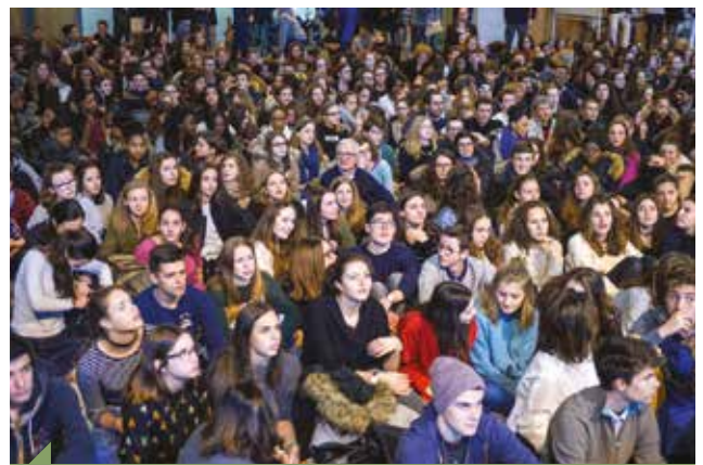
Ce week-end des 17 et 18 novembre à Paray est organisé par les aumôneries de l'Enseignement public.