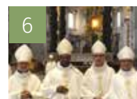
6 VIE DE L'ÉGLISE Spécial Synode 2018