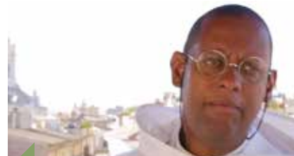
Mgr David Macaire, archevêque de Saint-Pierre et Fort-de-France, en Martinique.

qu'ensemble, nous allons poser des décisions concrètes pour aider tous les jeunes, catholiques ou non, car nous souffrons tous des mêmes problématiques, mais nous avons tous un cœur rempli d'amour et beaucoup d'énergie pour agir ensemble.