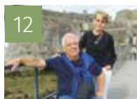
12 VIE DES PAROISSES Un dimanche autrement à Meyzieu pour mieux tenir compte du handicap en paroisse