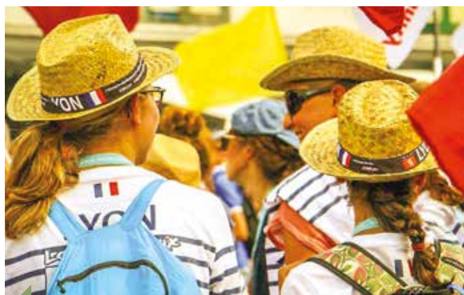
Groupe de jeunes du diocèse aux JMJ.