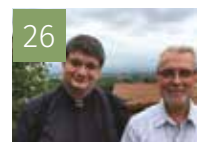
26 RENCONTRES PASTORALES Deux regards complémentaires pour l'unité de la paroisse