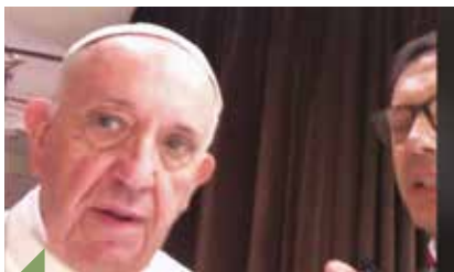
Le pape François.

Retrouvez l'intégralité des interviews sur synodejeunes.fr