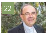
22 AGENDA DES ÉVÊQUES OFFICIEL