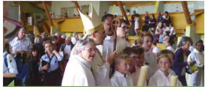
Rentrée du bassin roannais à Ressins Le cardinal Barbarin, ici entouré des servants, a présidé la messe de rentrée du bassin roannais, qui avait lieu cette année au lycée agricole de Ressins.