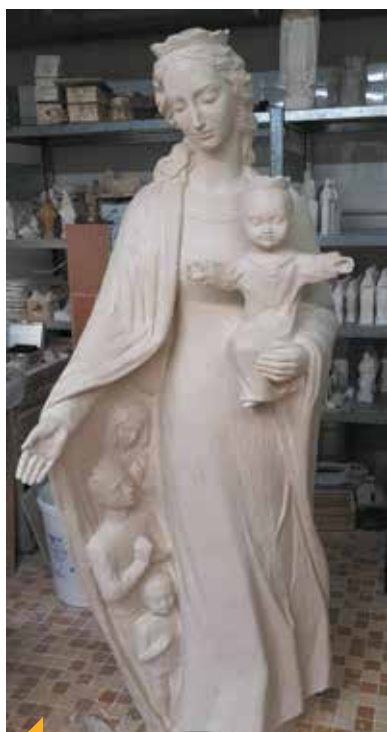
Cette statue représente Marie, Secours des Chrétiens ou Marie Auxiliatrice en résine acrylique, elle mesure 1m70 et a été installée le 10 mai dernier.