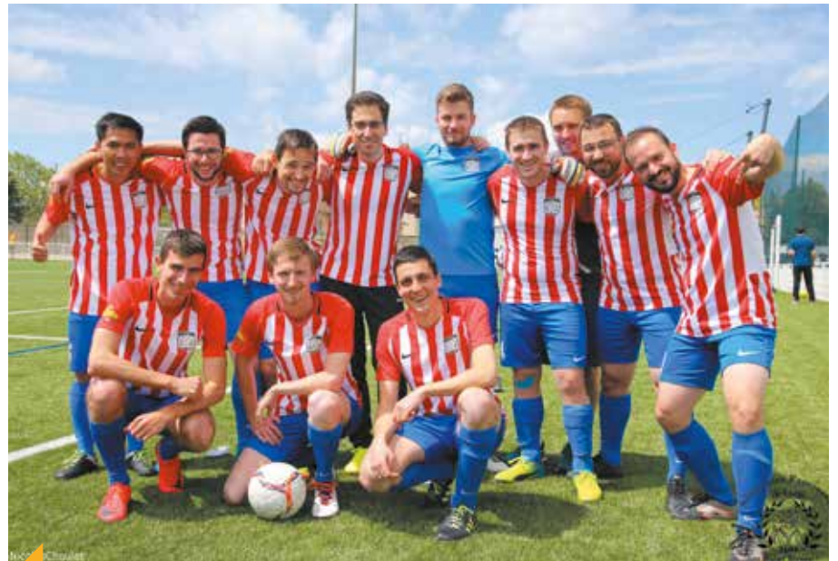
Les séminaristes de Lyon se sont entraînés de longues semaines et seule une partie d'entre eux a été sélectionnée pour constituer l'équipe qui s'est imposée le 4 mai dernier, face aux séminaristes de Nantes.

Malgré une météo capricieuse et le désir ardent de gagner chez toutes les équipes, les arbitres officiels de l'évènement ont su garantir une ambiance fraternelle et conviviale ! Cet évènement est unique dans l'année de formation des futurs