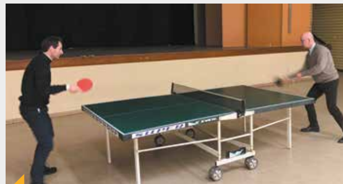
L'histoire ne dit pas quelle paroisse est sortie victorieuse de ce match de ping-pong !