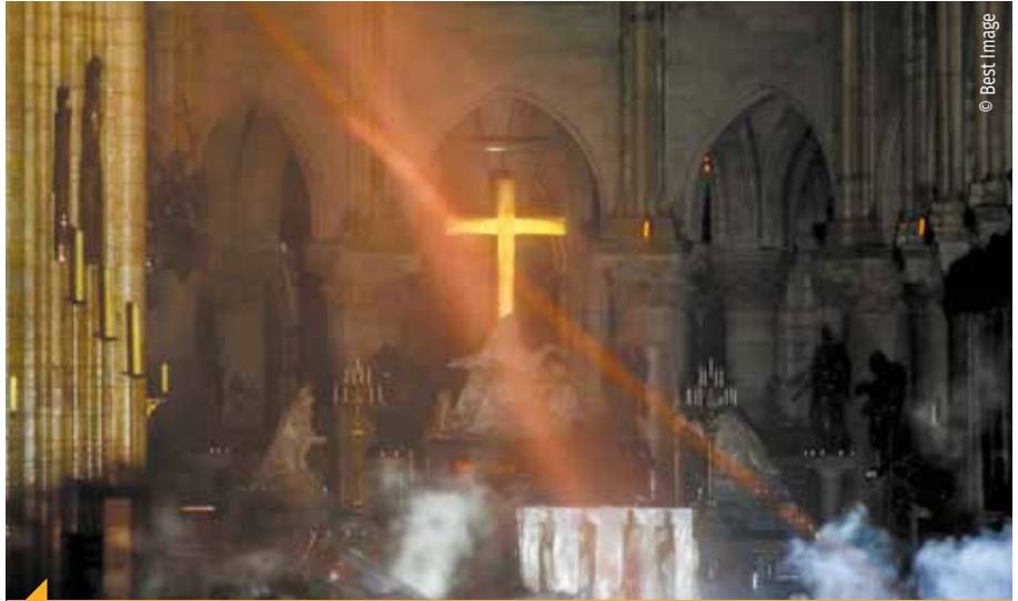
Comme un signe d'espérance, la croix et l'autel de la cathédrale, restés intacts parmi les débris de charpentes qui jonchent le chœur.

La miette de pain, c'est le Corps de Dieu, le Corps du Christ, son Corps ressuscité, insaisissable sauf s'il se donne. Et il se donne : « Ma vie nul ne la prend, c'est moi qui la donne ». Et puis ce que nous avons fêté le Jeudi Saint : « Prenez, mangez, ceci est mon Corps ». Cette miette de pain, c'est la Vie de Dieu qui se communique. Cette miette de pain donne à ceux qui la reçoivent la vie éternelle, elle nous ouvre les portes du Ciel, elle nous fait participer à la résurrection du Christ, cette résurrection que nous fêtons aujourd'hui et qui appellera notre propre résurrection dans la chair au retour du