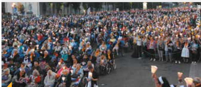
Le pèlerinage de Lourdes, l'un des plus grands événements de notre diocèse chaque année, est accompagné par de nombreux prêtres diocésains.

Chaque année, ce sont environ 3000 pèlerins (hospitaliers, malades, jeunes, pèlerins...) du diocèse qui partent à Lourdes ! Un moment fraternel et convivial qui demeure aujourd'hui un des plus grands pèlerinages de notre diocèse. Il aura lieu cette année du 10 au 15 juin 2019. Au programme, excursions à Bartès, Saint-Savin et Bétharram, conférences, témoignages, concerts, laudes et vêpres. Chaque année, le service des pèlerinages du diocèse de Lyon organise un pèlerinage à Lourdes qui rassemblera 2 800 pèlerins en juin prochain, dont un millier de jeunes de 13 à 16 ans.