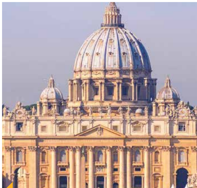
L'origine du denier de Saint-Pierre remonte au VIIIe siècle, quand les Anglo-Saxons commencèrent à envoyer un tribut annuel au pape.