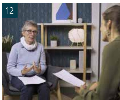
12 LE DOSSIER AGIR ENSEMBLE CONTRE LES ABUS SEXUELS