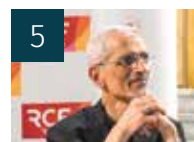
5 VIE DE L'ÉGLISE mort de l'évêque d'Antelias, au Liban