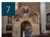
7 VIE DU DIOCÈSE Débat : « Réparer l'Église »