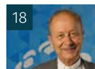
18 L'AGENDA DES ÉVÊQUES