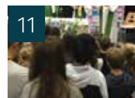
11 VIE DES PAROISSES Le doyenné des monts de la Madeleine réuni à Rensaison