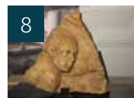
8 VIE DU DIOCÈSE Berceau du christianisme à Lyon, expo prolongée