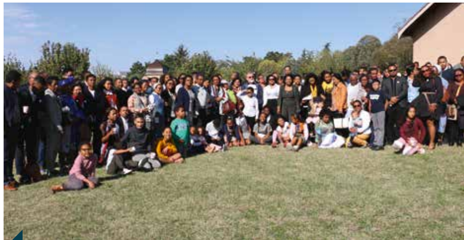
Une partie de la communauté malgache de Lyon, ici réunie chez les sœurs trinitaires de la Croix-Rousse.