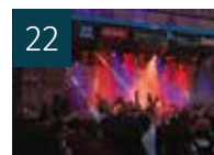
22 CULTURE Fourvière en Lumière ! Esprit Live 2019