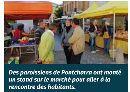
Des paroissiens de Pontcharra ont monté un stand sur le marché pour aller à la rencontre des habitants.

Dimanche 6 : Projection du film Little Boy au cinéma Jacques Perrin de Tarare, avec 150 personnes.