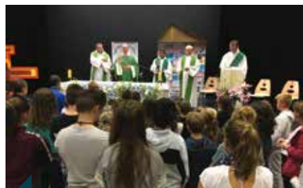
Tous les prêtres du doyenné réunis pour concélébrer lors de la journée de rentrée du 5 octobre dernier, à Renaison.

Le 5 octobre dernier, les quatre paroisses constituant le doyenné des Monts de la Madeleine, paroisses Saint-Jean-en-Pacaudois, Saint-Jacques-en-Côte-Roannaise, Sainte-Madeleine-en-Côte-roannaise et Sainte-Thérèse de l'Enfant Jésus ont fait leur rentrée à Renaison, non loin de Roanne. Pendant l'après-midi, une kermesse et un atelier de slam ont été proposés aux plus jeunes. Chacun a présenté ce qui est vécu localement... La messe a rassemblé près de 500 personnes, — avec distribution de graines de moutarde aux enfants pendant l'homélie ! —, suivie d'un repas partagé géant et d'un spectacle de slam avec Euréka, slameur professionnel choisi par le diocèse dans le cadre des célébrations de l'année Saint-Irénée.