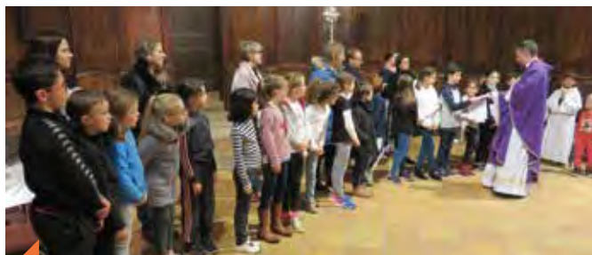
Les enfants en 1 ère année de caté reçoivent leur Bible.

Pour le lancement du parcours 1 ère communion, près de 70 enfants accompagnés de leurs parents se sont retrouvés à Colombier pour une journée de retraite. Les parents ont suivi la séance avec leurs enfants ; Ils ont ainsi pu profiter des enseignements des catéchistes et des prêtres. Le matin a été l'occasion de (re)découvrir les grandes étapes de l'Alliance entre Dieu et son peuple. L'après-midi, c'est à partir de la rencontre entre Jésus et Zachée que le sens des différentes parties de la messe a été abordé : une rencontre, une conversion, l'écoute de la Parole, une