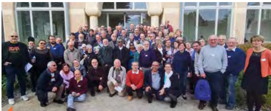
Notre diocèse compte désormais une centaine de diacres, ici réunis au domaine Lyon-Saint-Joseph.