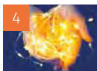
4 VIE DE L'ÉGLISE Journée mondiale des malades « Ta nuit sera lumière »