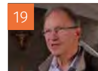
19 OFFICIEL Nominations Décrets