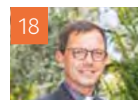
18 AGENDAS DES EVÊQUES