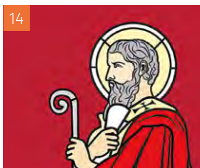
14 LE DOSSIER IRÉNÉE DE LYON L'UNITÉ EST TOUJOURS À RECHERCHER