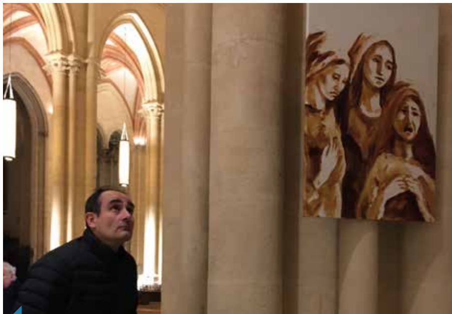
Les 15 toiles de François-Xavier de Boissoudy sont exposées jusqu'au 12 avril à la primatiale Saint-Jean-Baptiste.

Le peintre expose depuis 5 ans à la galerie Guillaume à Paris 8 e . Il a notamment été l'auteur de l'exposition « Art Sacré ? » à la Cathédrale d'Evry en 2013, et a été invité en 2014 au Couvent des Dominicains, pour les 400 ans de leur fondation, au 222 de la rue du Faubourg Saint Honoré, pour une exposition sur les Veilleurs, intitulée « Une Annonciation Française ». Le chemin de Croix exposé aujourd'hui à la primatiale l'a d'abord été lors du