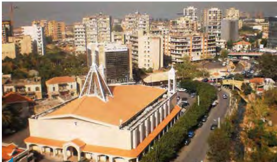
La paroisse Mar Elias, à Antelias au Liban, est jumelée avec la paroisse Saint-Nizier, à Lyon 2 e .