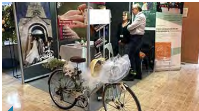
Le Diocèse de Lyon était présent au salon du mariage qui s'est tenu les 25 et 26 janvier dernier au centre de congrès de Lyon.

Plus de 60 couples ont approché les bénévoles qui ont reçu un bon accueil, beaucoup de curiosité et de belles rencontres.