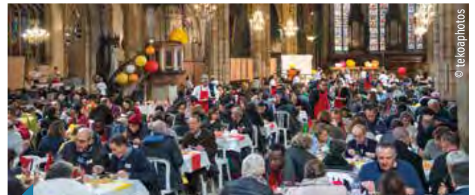
Heureux les invités : déjeuner organisé à l'occasion de la journée mondiale de lutte contre la pauvreté à Saint-Bonaventure le 18 novembre 2018.

A l'occasion de son dixième anniversaire, la Fondation Saint-Irénée lance les Irénée d'or prix 2020 pour l'éducation, la culture,