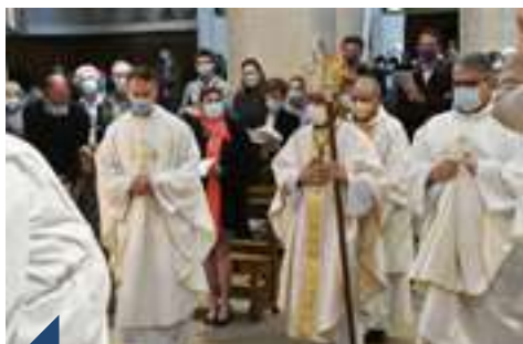
Parmi les fidèles à Villefranche-sur-Saône, le 25 avril dernier, dans le doyenné de Fontaine-Villefranche.