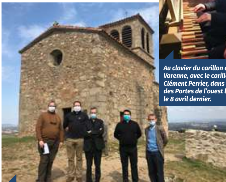
Devant la chapelle Saint-Vincent, qui surplombe la vallée du Rhône, le 20 avril dernier dans le doyenné de la Vallée du Rhône.