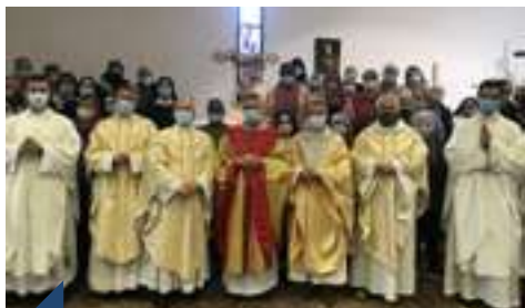
Le 27 avril dernier, avec les équipes de prêtres et de laïcs du doyenné des Portes du Dauphiné.