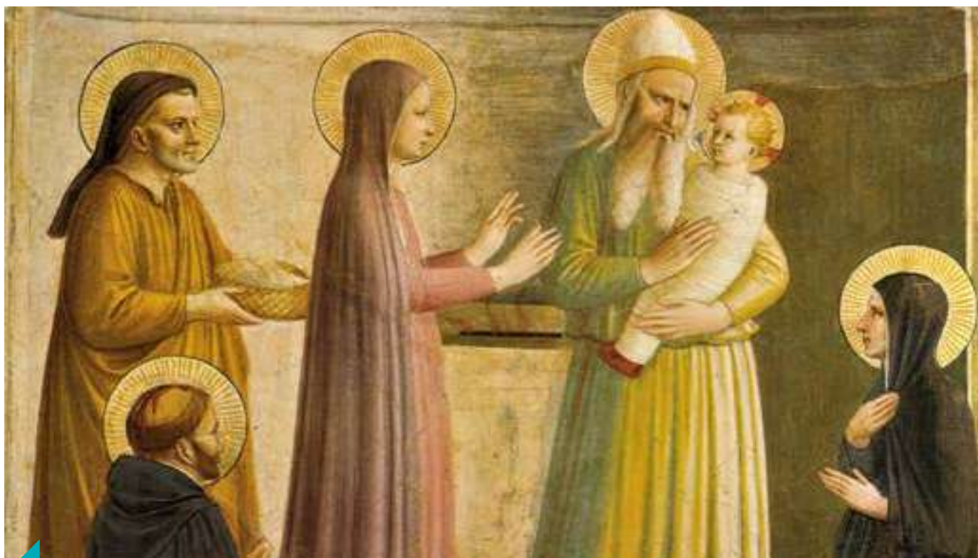
Présentation de Jésus au Temple, Fra Angelico, fresque peinte dans les années 1440, pour le couvent San Marco de Florence (détail).

Dans cette perspective on peut redonner un sens fort et appelant aux trois vœux religieux : le vœu de pauvreté ne dit pas un désintéret, encore moins un mépris des biens de ce monde créé par Dieu, mais bien une affirmation que Dieu seul peut combler notre cœur ; Jésus ne disait rien d'autre au jeune homme riche : " Donne tout et tu auras un trésor dans le ciel " (cf Mc 10, 21). De même la chasteté dans le célibat consacré n'est pas inintéret pour le mariage ou la résultante de nos déceptions, mais souligne que la pleine fécondité et l'ultime communion des personnes ne se trouvera que dans la vie de la gloire. Le vœu d'obéissance, sans doute le plus exigeant, n'est pas renonciation à la liberté humaine comme don empoisonné fait par le créateur à la personne humaine, mais chemin pour apprendre à bien user de cette liberté non comme revendication d'autonomie mais comme dépendance choisie et heureuse dans l'amour par rapport à plus grand que moi, à Dieu ultimement.