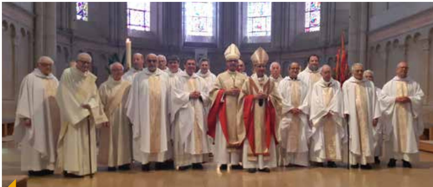
70, 60, 50, 40, 30, 25, 20 ou 10 ans de ministère sacerdotal ou diaconal pour les prêtres à l'honneur cette année.

leur ministère ainsi que nos frères africains ou asiatiques, surtout ceux qui sont incardinés chez nous, pour tout ce qu'ils apportent à notre Église locale », leur a écrit l'archevêque, en les invitant à cette rencontre.