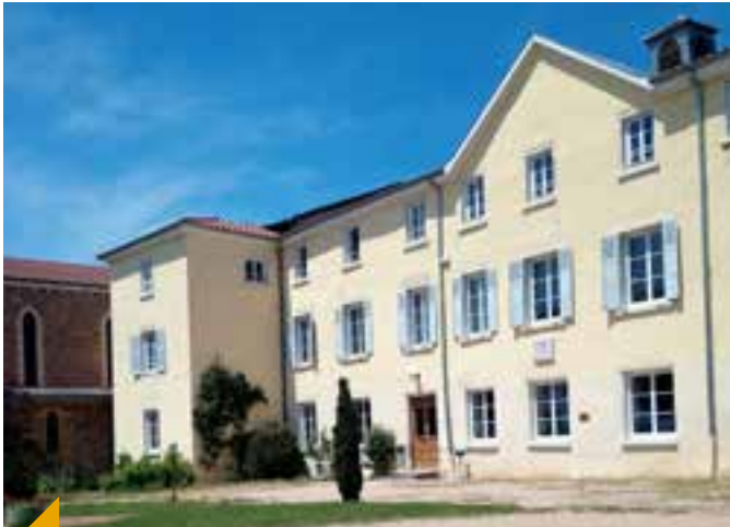
La Neylière propose 2 retraites spirituelles chaque été.