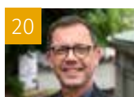
20 AGENDA DES ÉVÊQUES