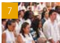
7 VIE DU DIOCÈSE 313 confirmations d'adultes le 5 juin dernier