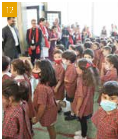
12 LE DOSSIER : RETOUR EN IMAGES SUR LES GRANDS ÉVÉNEMENTS DU PRINTEMPS