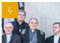
4 VIE DE L'ÉGLISE Les évêques de France se sont réunis à Lyon en juin