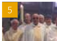
5 VIE DU DIOCÈSE Les prêtres et les diacres jubilaires à l'honneur