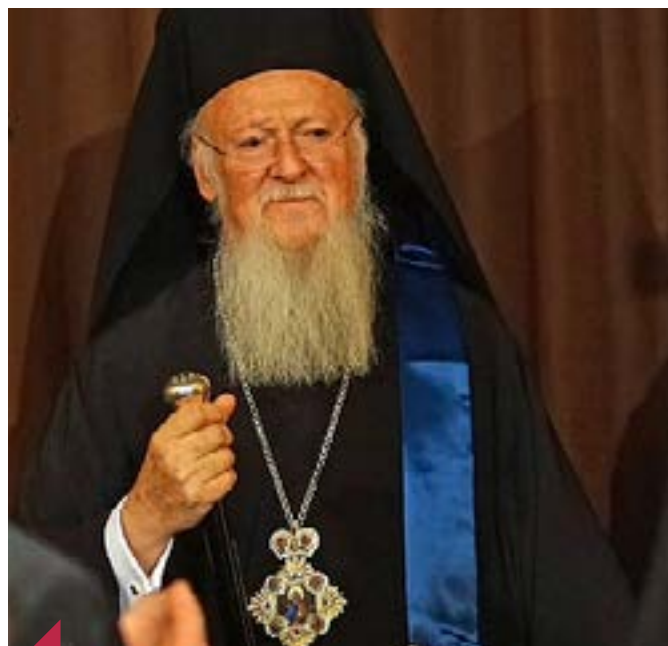
Bartholomée 1 er , chef spirituel suprême du monde chrétien orthodoxe.