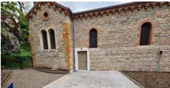
Pour mettre aux normes accessibilité l'église de l'Immaculée Conception dans le centre de Vénissieux, une porte a été percée dans le mur de l'édifice, nécessitant la supervision du chantier par un architecte.

Depuis 2014, une loi stipule que les établissements recevant du public doivent être mis en accessibilité pour les personnes handicapées. Les églises n'échappent pas à cette loi. C'est pourquoi depuis lors, le diocèse a mis en place une liste déclarée en Préfecture des églises et maisons paroissiales à