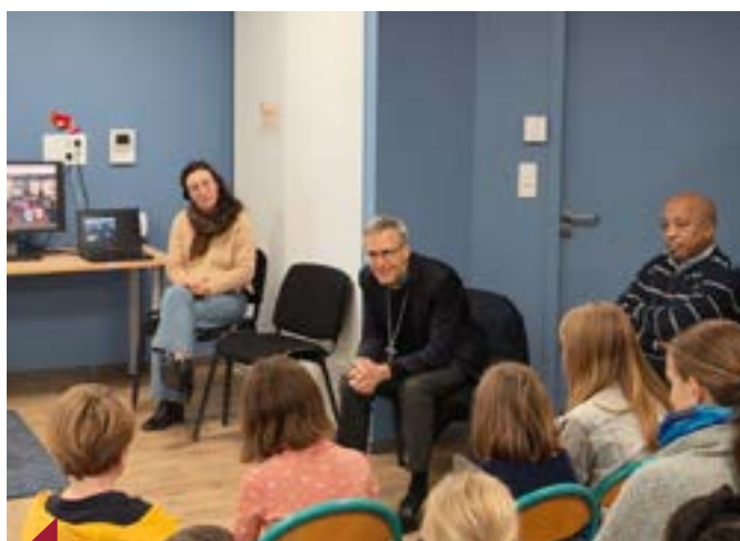
Rencontre avec les enfants de l'école Jeanne d'Arc.