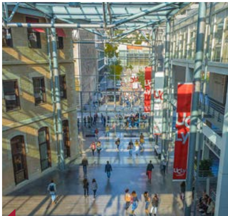
Réhabilitation architecturale réussie : l'impressionnante rue intérieure de l'UCLy.