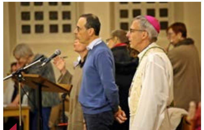
La veillée de prières.

aujourd'hui avec nos frères et avec Dieu. N'hésitons pas à demander la grâce de Dieu pour nous aider" .