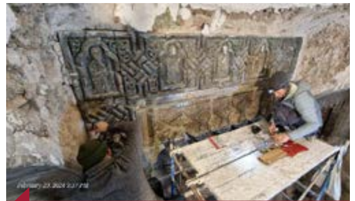
Église Mar Toma, au cours de sa restauration.