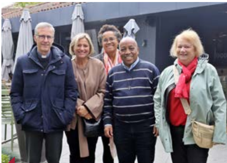
Mgr Olivier de Germay avec les élus de Craponne.