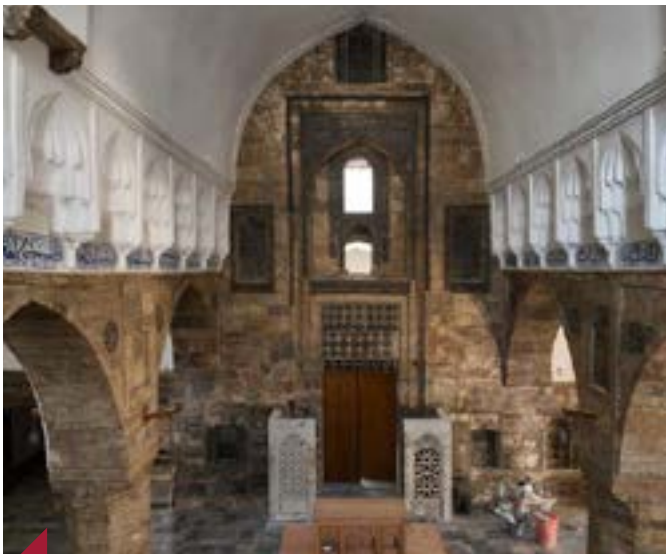
Église Al-Tahira des Chaldéens après restauration.

Le 15 octobre 2025, la vieille ville de Mossoul a retrouvé deux de ses joyaux : les églises Al Tahira (chaldéenne) et Mar Toma (syriaque-orthodoxe), restaurées après des années de ruine. Ces édifices avaient été gravement endommagés durant l'occupation de l'État islamique et la libération de 2017. Construite en 1862, Al Tahira était le cœur de la communauté chaldéenne. Sa toiture effondrée et ses murs éventrés ont été rebâti grâce à un programme mené par l'Unesco avec le soutien d'artisans locaux. Mar Toma, l'une des plus anciennes églises de Mossoul, liée à la tradition de l'apôtre Thomas, a également retrouvé sa splendeur grâce à la fondation Aliph et à l'Œuvre d'Orient.