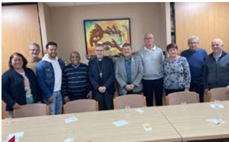
Avec les élus de Saint-Genis.

Plus tard en soirée, son enseignement sur la liturgie a marqué les esprits : « La messe n'est pas un spectacle mais une rencontre entre nous et avec Dieu. Les gestes, les chants, les postures, les rites nous aident à entrer dans le mystère de la foi qui est au-delà d'un discours sur Dieu. »